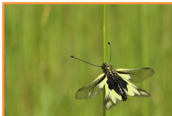
Ascalaphe soufré, Photo : F. Moreau, N18