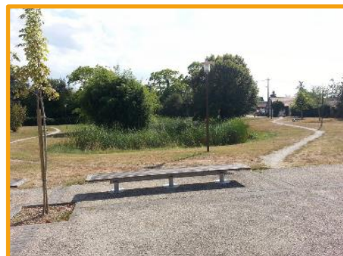
Mare communale