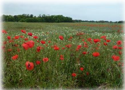
Les abords du bourg.

Les Montils est une commune située dans le département de Loir-et-Cher d'un peu plus de 2000 habitants au Sud de Blois. Le territoire des Montils est composé principalement de territoires agricoles avec des secteurs où s'imbriquent cultures, vignes, friches et jeunes boisements notamment aux abords du bourg. Des boisements plus importants sont présents sur le plateau à l'ouest et à l'est du bourg ainsi que dans la vallée du Beuvron où subsistent quelques parcelles de prairies.